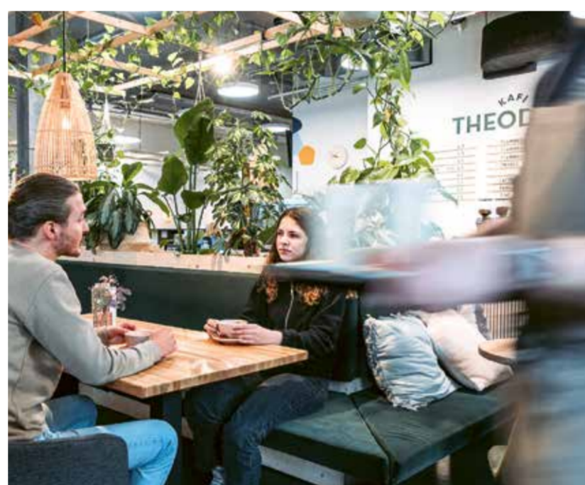
Ein gemütlicher Nachmittag im Kafi Theodor.

Auch der Produktionsbereich stellt sich auf die neuen Anforderungen der Klientinnen und Klienten sowie der zuweisenden Stellen ein. Die grössten Herausforderungen in den Arbeitsbereichen waren jedoch die Abgänge von zwei langjährigen Führungspersonen. Eine Person musste leider wegen einer Krebserkrankung von einem Tag auf den anderen die Arbeit niederlegen. Die andere Person hat sich beruflich neu orientiert. Wir sind sehr dankbar, dass wir noch vor Ende des Jahres die Nachfolger dieser beiden verdienten Personen bestimmen konnten und die Bereiche damit stabilisiert wurden. →