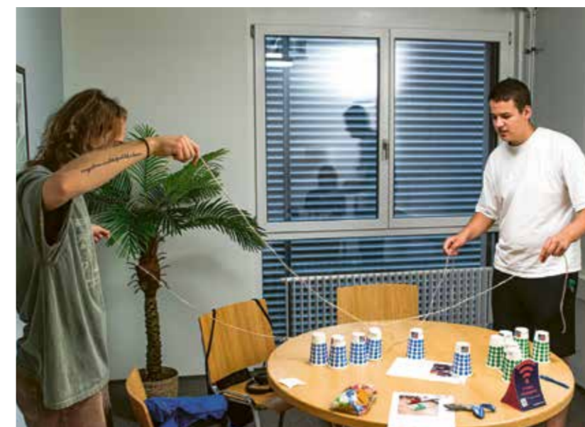
Spiel und Spass am Lernendtag 2022.

In den letzten Jahren sind viele Ressourcen in den Ausbau unseres Bildungsbereichs geflossen und wir haben unser Angebot vergrössert. Wir sind dankbar, dass wir rechtzeitig bereit waren, einem Bedürfnis unserer Gesellschaft zu begegnen. Die Jugend hat unter den Auswirkungen der Pandemiejahre wohl am stärksten zu leiden, und so kamen insbesondere die niederschweligen Angebote für etliche junge Frauen und Männer gerade rechtzeitig.