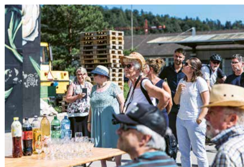
Die Vernissage des 20 Meter hohen «Yes»-Graffitis.

«Wir betonten die Gemeinschaft, feierten Feste, arbeiteten Hand in Hand, schüttelten Hände und gingen aufeinander zu.»