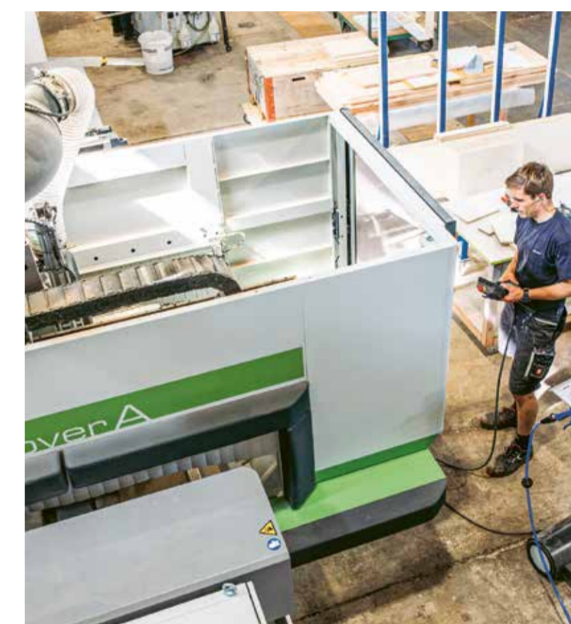
CNC-Maschine im Einsatz in der Schreinerei Q.

Namentlich bedanken möchten wir uns bei der Ernst Göhner Stiftung, die sich mit 40 000 Franken am CNC-Bearbeitungszentrum für die Schreinerei Q beteiligt hat.