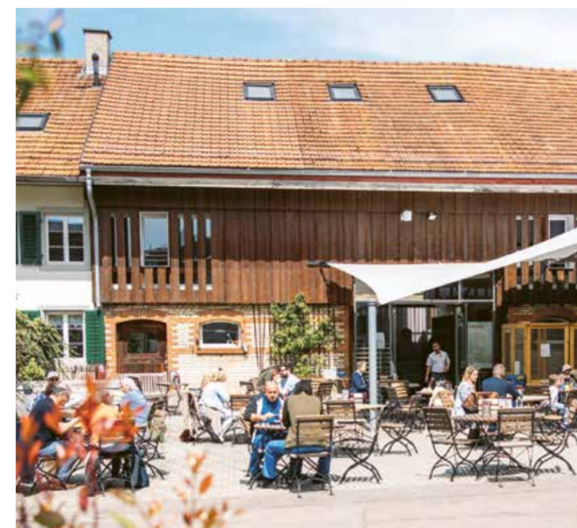
Das KafiMüli während der Messe «Frühlingsgeflüster».

Nach der Lektüre dieser wenigen Zeilen sind Sie wohl mit uns einverstanden, dass dies ein völlig normales Jahr war.